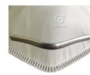
Front Nose Bar